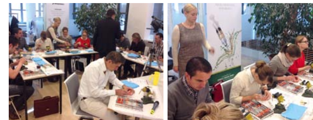
Eine knifflige Aufgabe, die Übung verlangt. Die Seminarteilnehmer lernen am Schweinekiefer und am Modell

Herzlichen Dank an die Firma Straumann für die verlässlich perfekte Organisation sowie an die Firma Hu-Friedy für das Sponsoring der Instrumente.