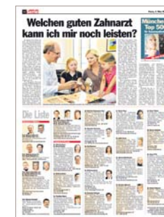
TZ Artikel über Zahnärzte