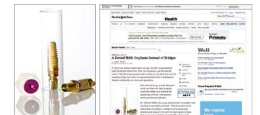
Implantat oder Brücke? Mehr unter www.nytimes.com

Implantate sind aus der modernen Zahnversorgung nicht mehr wegzudenken. Wenn es um die Entscheidung zwischen Brücke oder Implantat geht, bietet das Implantat die entscheidenden Vorteile ... Mehr Informationen unter www.nytimes.com/2009/11/17/health/17brod.html?_r=2&em