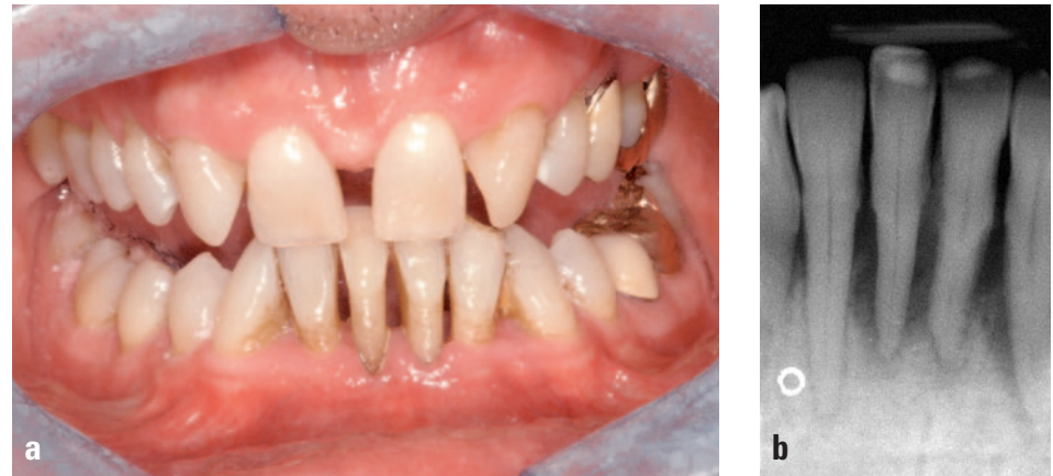
Abb. 4a und b Gestörter „envelope of function“ führt zu einem Okklusionstrauma mit Zahnelongation und Sondierungstiefen von 6 bis 9 mm. Kodestruktiver Prozess?