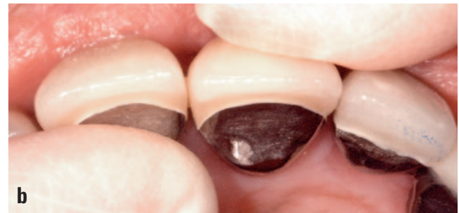
Abb. 5a und b Frühkontakte (Fremitus) an den Zähnen 11 und 21 mit sichtbar erhöhter Zahnmobilität

Zu den okklusalen Interferenzen, von denen man heute glaubt, dass sie die „therapiebedürftigsten“ sind, werden Fremitus-Frühkontakte (Abb. 5a und b) und posteriore Balanceseitenkontakte gezählt 14,15 . Die Abstützung der Kaukräfte und deren Verteilung auf einen größeren Bereich kann zur Schonung geschädigter Parodontien über die Schienung gewährleistet werden. Eine notwendige Pfeilervermehrung zur Unterstützung der maximalen Abstützung ist oft durch prothetische Versorgungen zu erreichen. Die Implantologie stellt in diesem Bereich eine schonende Variante dar, um die Hartsubstanz benachbarter Zähne zu schützen und verloren gegangene Stützzonen zu rehabilitieren (Abb. 5b).