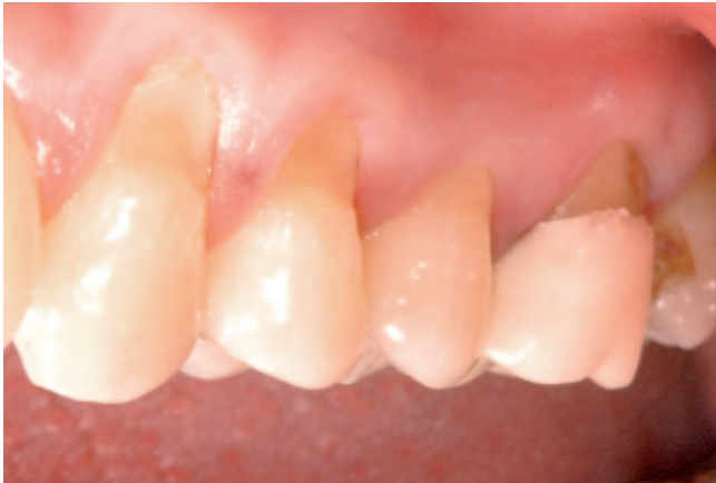
Abb. 2a Multiple nichtkariöse zervikale Läsionen (Abrasionen)