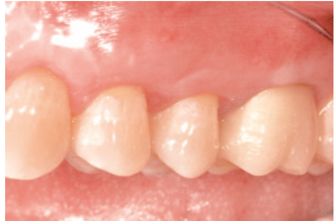
Abb. 2b Nach Therapie der nichtkariösen zervikalen Läsionen mittels Rezessionsdeckung und Krone 26